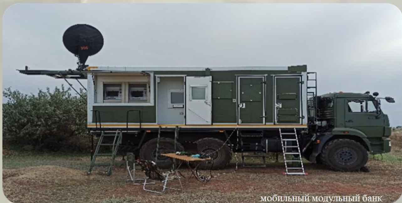
мобильный модульный банк